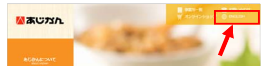
▲「英語版サイト」リンク場所