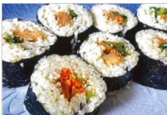
船ばしのまきずし