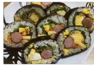
カラフル シャキフワロール