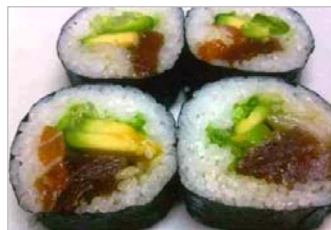
はわいあんろーる