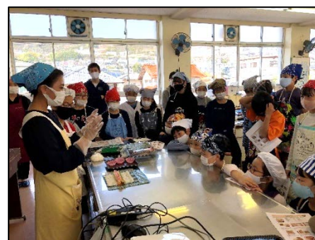
巻寿司教室の様子

2019年より毎年広島市立井口明神小学校にて、巻寿司の歴史や文化、節分の風習、巻寿司の巻き方など、食育授業を実施しています。