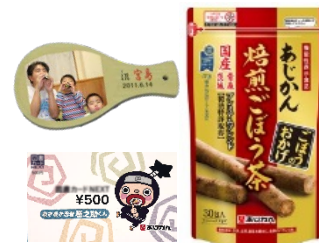
（画像はイメージです。）

500円分クオカードまたは図書カード、「あじかん焙煎ごぼう茶プレミアム ブレンドごぼうのおかげ」、写真入りびわしゃもじなどをプレゼントいたします。